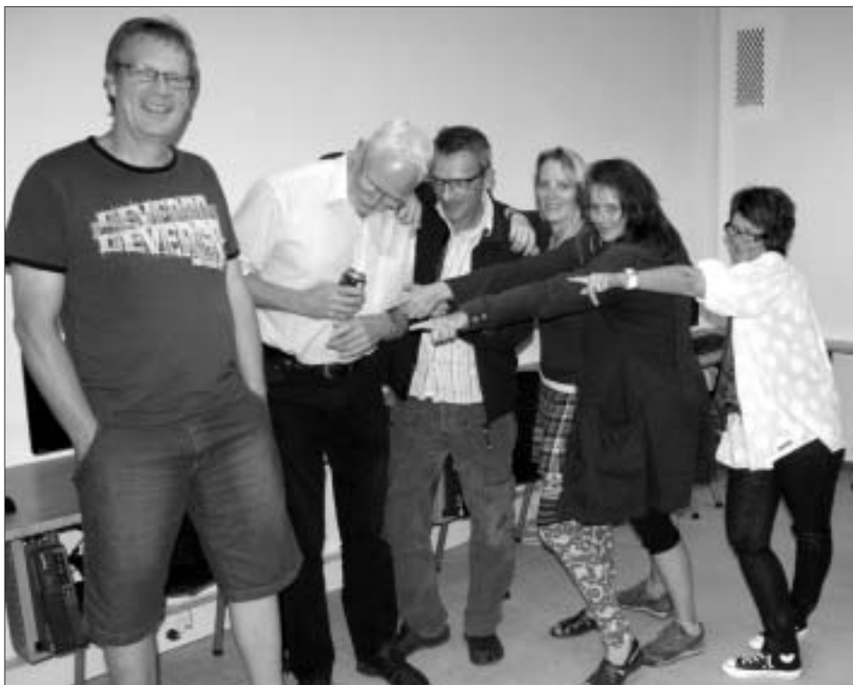
Som det tydelig ses, er skuespillere og tekstforfattere i fuld gang med at stable et brag af en lokalrevy på benene.

Så alt i alt vil der ikke være nogen undskyldning for ikke at købe billetter til denne store aften. Idrætsforeningen håber på, at hallen bliver fyldt med over 500 mennesker, så der kan blive et stort overskud til ungdomsarbejdet i klubben.