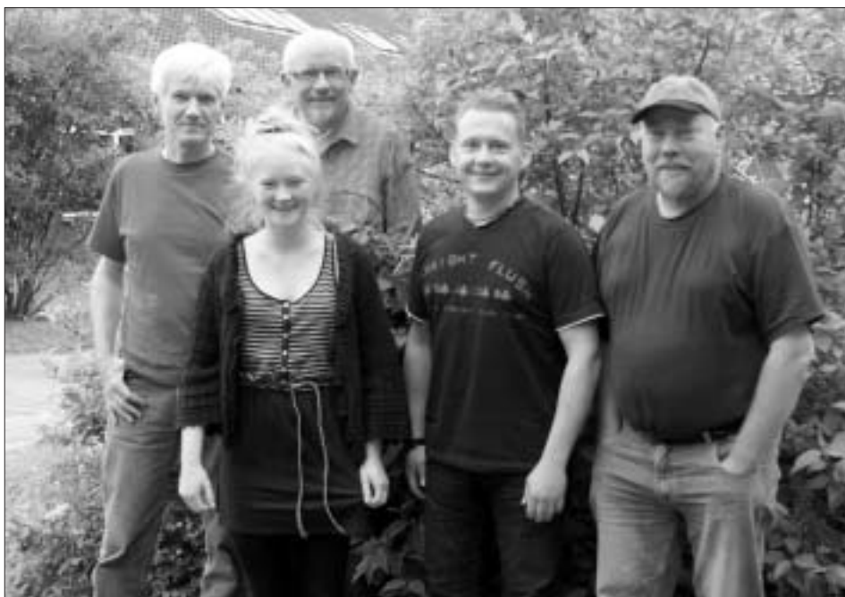
Nye ansigter er med i dette års revyorkester.